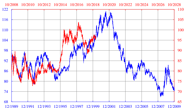
圖一：十七年十個月前後的美匯指數

圖二為幾乎同一拼圖，只是時差稍短，十六年半，但僅差之年幾，結果距之千里。此圖由美匯盤古初開起已重疊至今，料大跌在即，理應較為可信，但近期稍為失準。