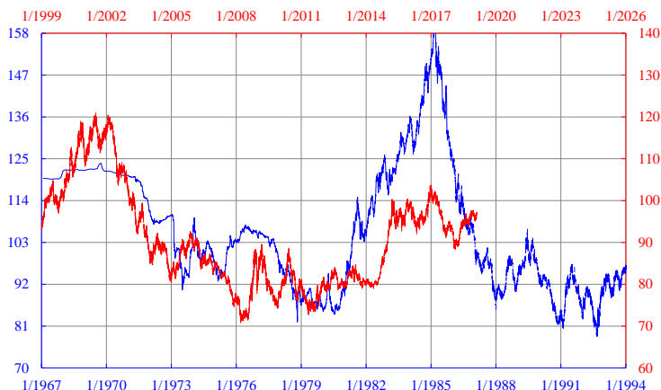
圖三：卅二年前後的美匯指數

純美匯圖看不通時，慣常的做法是參考其他相關的拼圖。瑞郎直盤從來表現穩定，甚少修正，圖四所見瑞郎將持續升至2027年，即美元應跌，與圖二、三的看法吻合。