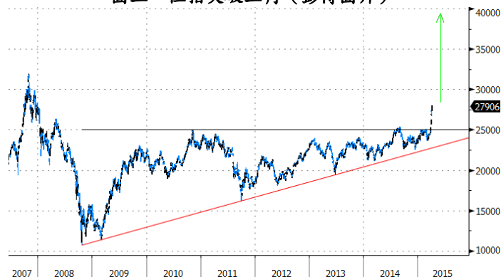
圖三：恒指突破三角

圖三是大家見慣的技術圖表。就算更不曉看圖的，都知這個上升三角是爆上格局。三角高度為2008年時14,000 (=25,000-11,000) 點，爆上亦近四萬 (=25,000+11,000)。