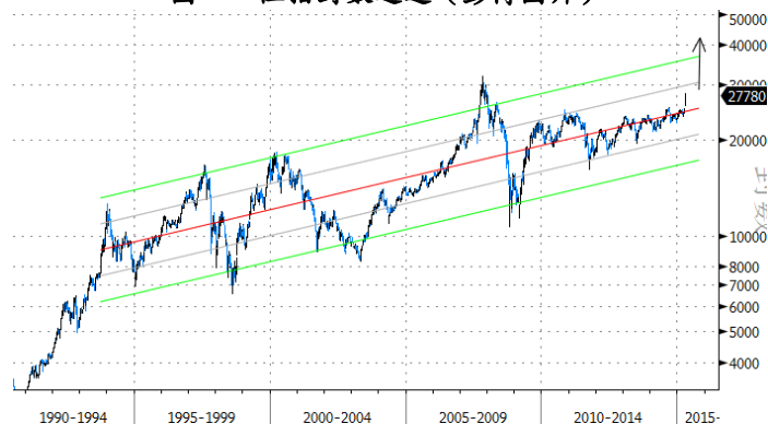
圖二：恒指對數通道

未有泡沫之象，除見諸市盈率外，亦可從對數通道裏找，在 Econophysics 文獻中，也以類似穿通道頂部原則來確認泡沫。圖二顯示恒指自 1993 年起角轉慢的對數通道，可見即使在近週爆升過後，目前仍處通道近中間處，連一個標準差也未達，遑論兩個；通常兩個標準差（有時更三個）也升穿才言泡沫也未遲。以此量度，高位也逾四萬。