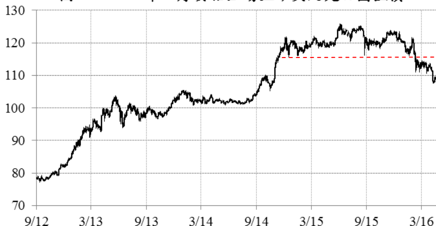
圖一：2012年9月安倍上場至今美元兌日圓匯價

事實上，雖然日本央行於2014年10月曾加碼QQE，但原來日本基礎貨幣按年增幅早於2014年2月見頂，其後持續向下。圖二所見，美國在三輪量寬期間均見基礎貨幣按年增幅顯著上升（綠圈），量寬完結後才緩步回落；但日本央行加碼QQE後，基礎貨幣按年增幅不升反跌，其持續向下的形態反而更似美國收水（紫圈），反映黑田在進一步壓低日圓上根本未盡全力，甚至打著紅旗反紅旗。當時若非歐元暴跌推高美匯，順帶扯高美日匯價的話，黑田之叵測居心恐怕早已圖窮匕現，暴露人前。